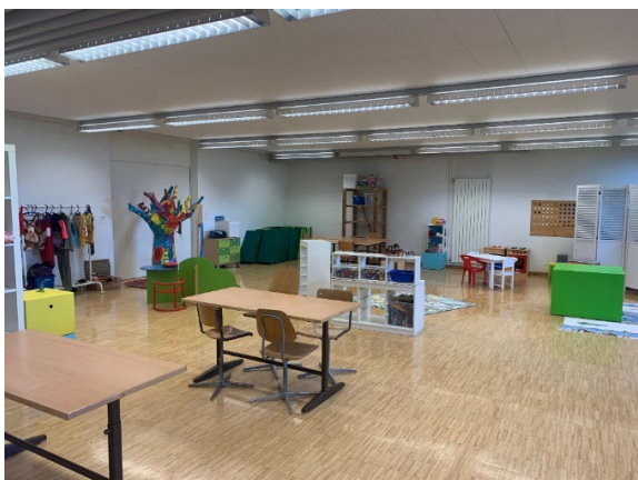
Salle Marteau transformée pour l'UAPE.

Récapitulatif des places en UAPE en Terre Sainte : Coppet 108/Founex 108/Chavannes de Bogis 84/ Commugny 84/Mies 84/Crans 84/Tannay 48 places.