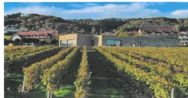
Maison des Vins de La Côte, à Mont-sur-Rolle

Le calcul s'effectue sur la base de la surface de référence énergétique selon le Registre fédéral des bâtiments et des logements (RegBL) ou, à défaut, la surface habitable du logement.