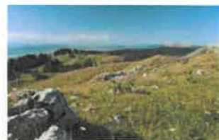
Parc naturel régional Jura vaudois