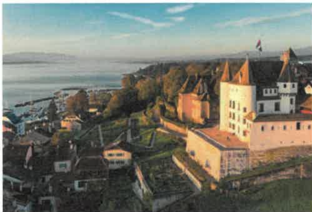
Vue sur le Château de Nyon